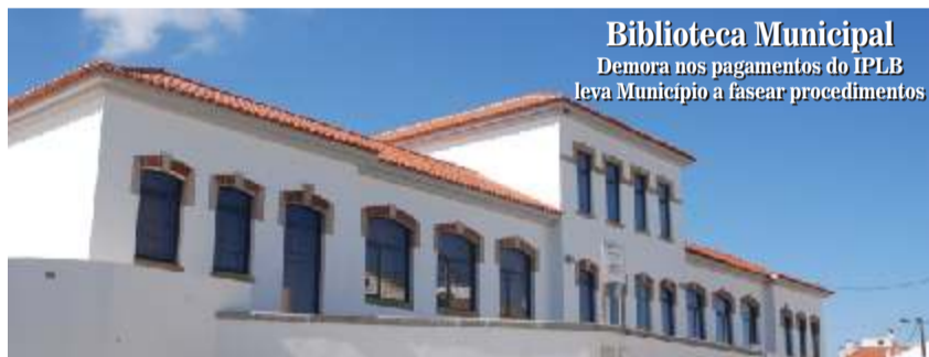
Biblioteca Municipal Demora nos pagamentos do IPLB leva Município a fasear procedimentos

- Foi acordado transferir para o Município um montante anual de 20.000€ para pagamento de encargos com as competências relativas à manutenção e apetrechamento das escolas básicas.