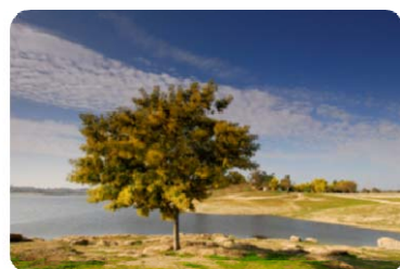
Barragem de Póvoa e Meadas

Foram, também, adjudicadas as empreitadas de Construção do Reservatório de Nave Fria e respectivas ligações, que garante o abastecimento a várias localidades no concelho de Arronches, e de Reabilitação das ETAR de Pé da Serra, Amieira do Tejo e Montalvão garantindo, assim, o tratamento eficaz dos efluentes daquelas localidades, que abrangem um total de cerca de 867 habitantes. Foram, ainda, consignadas a “Adução de água a Montalvão” a 26 de Abril e a “Execução da remodelação das ETAR de Alter do Chão, Ervedal e Chança” a 26 de Março.