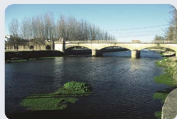
Ponte de Sôr

A Estação de tratamento de Água da Póvoa está dotada da mais moderna tecnologia para fazer face ao tratamento da água superficial com origem na albufeira de Póvoa e Meadas, garantindo padrões de qualidade à água fornecida aos municípios que cumprem na íntegra a legislação em vigor. Os restantes pontos de entrega encontram-se em fase final de execução prevendo-se brevemente a sua entrada em funcionamento.