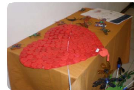
Coração feito de tampas

tratamento de águas residuais, evidenciando sempre o cumprimento da legislação aplicável e o zelo pelos mais altos padrões de protecção do ambiente.