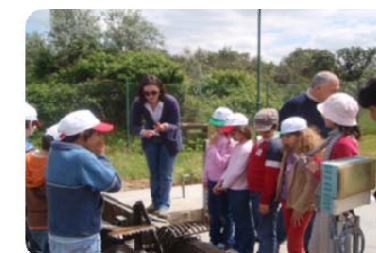
Visita de estudo à ETAR das Galveias

Assim, e no âmbito das visitas foi abordado o ciclo urbano da água, os diferentes trabalhos efectuados pela AdNA, a racionalização de um bem tão escasso que é a água e foram descritas as diferentes etapas de tratamento de uma ETAR.