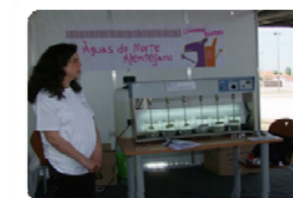
Demonstração com o JAR-TEST

No sentido de sensibilizar as crianças para a importância do tratamento da Água, foram entregues folhetos informativos e realizadas demonstrações de ensaios de tratabilidade de água através do aparelho JAR-TEST, que simula um processo físico-químico para o tratamento de água, por coagulação/floculação.