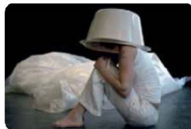
"Personagens de água"

educação ambiental às crianças presentes, sendo da responsabilidade do Centro de Artes garantir a participação das respectivas crianças.