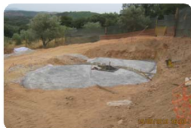
Reservatório de Nave Fria - início da obra